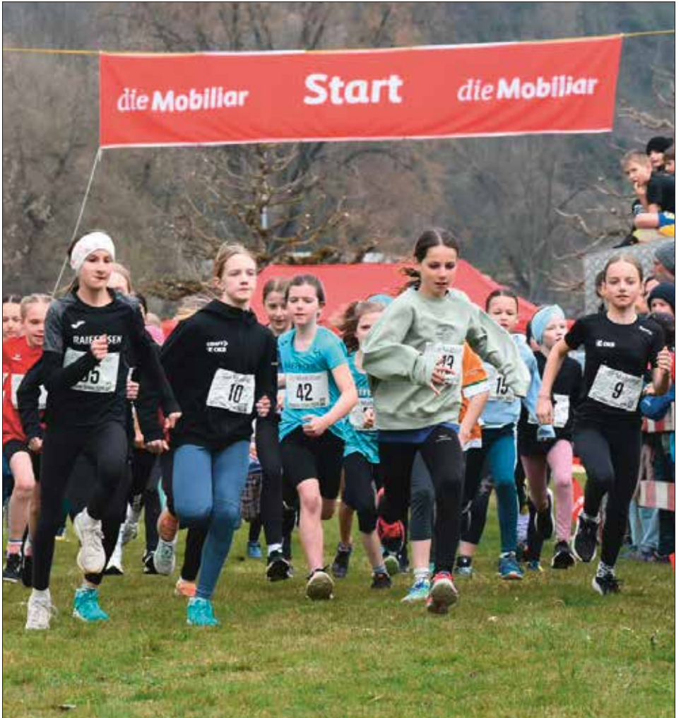
Obwaldner Schüler- und Volkscross 2026

Offizielles Vereinsorgan Turnverein STV Sarnen, Männerriege, Damenturnverein