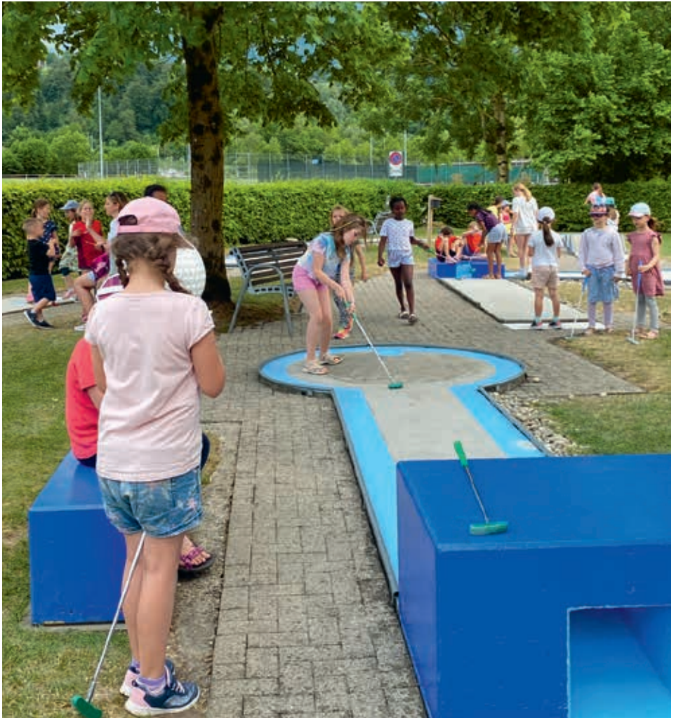
Die Mädchenriege beim Minigolfen.

Offizielles Vereinsorgan Turnverein STV Sarnen, Männerriege, Damenturnverein